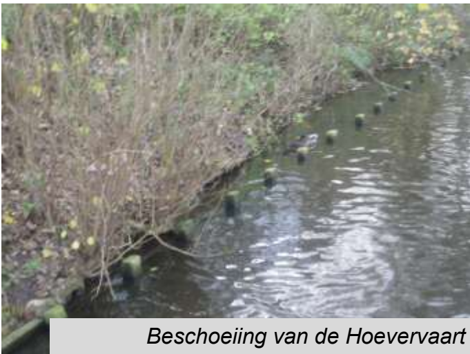
Beschoeiing van de Hoevervaart

De thema's waar het bij het NAP over gaat omvatten de leefbaarheid in brede zin: kwaliteit van de woningen en de openbare ruimte, de veiligheid, het voorzieningenniveau inclusief de sociale voorzieningen, de zaken rond werk en inkomen. Het plan is om per wijk zowel een korte termijnplan (de beheeragenda – 2 jaar) als een lange termijnplan (de ontwikkelagenda – tot 10 jaar) op te stellen.